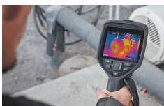
高視野角 高輝度IPS液晶