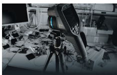
タイムラプス撮影 (E96)