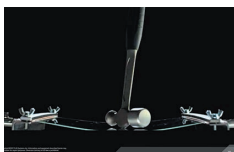
耐衝撃液晶ディスプレイ採用